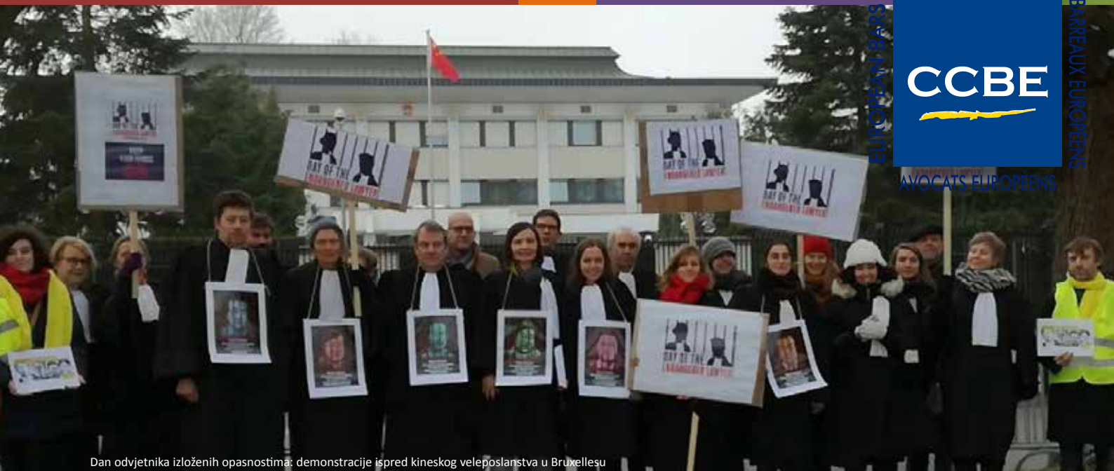
Dan odvjetnika izloženih opasnostima: demonstracije ispred kineskog veleposlanstva u Bruxellesu