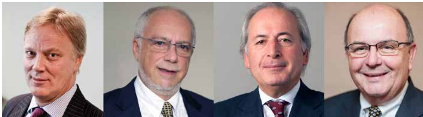
Ruthven Gemmell WS

Gospodin Gemmell je bio predsjednik Škotske odvjetničke komore (Law Society of Scotland) od 2006. do 2007. godine, i pridružio se CCBE-u kao škotski predstavnik u izaslanstvu Ujedinjenog Kraljevstva 2007. godine. Ruthven Gemmell je predsjedanje preuzeo od Michela Benichoua.