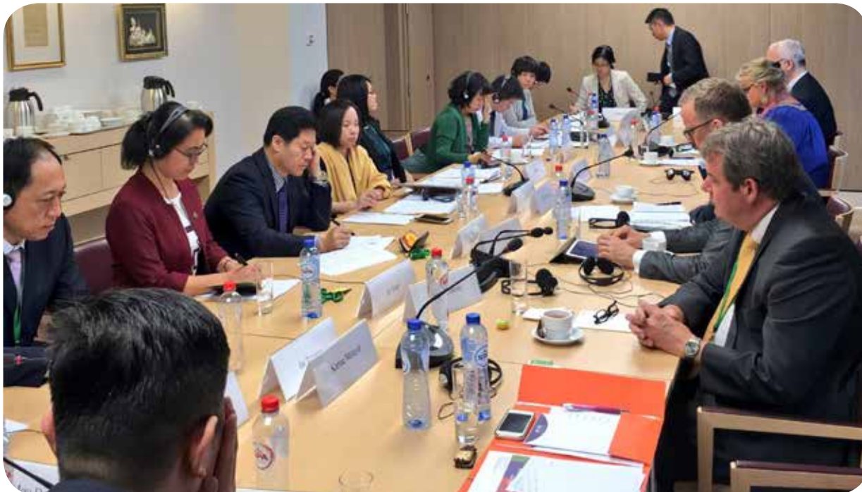
Dijalog o ljudskim pravima EU-Kina, Bruxelles

s izuzetkom slučaja Xie Yang. Brdo detalja. Detalja koja se ne mogu provjeriti, ponekad kontradiktornih. Napredak u sustavu pritvora, a hvale se i s prevencijom mučenja. Tvrdili su da se mučenje oštro kažnjava, da se čuvari sada strogo nadziru. Pozvani smo da dođemo u Kinu i da se sami u to uvjerimo.