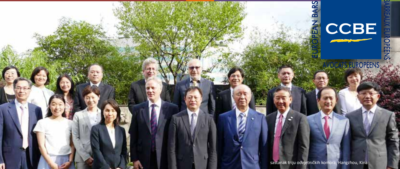
sastanak triju odvjetničkih komora, Hangzhou, Kina