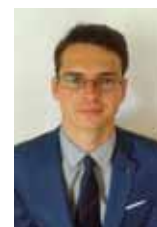
Piše: Vladimir Vučković, mag. iur.

U skladu s čl. 157. važećeg ZPP-a, ako tuženik nije dao povod za tužbu i ako je, prije nego što se upustio u raspravljanje o glavnoj stvari, pri-