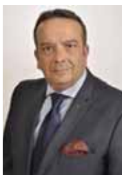
Piše: Berislav Matijević

dipl. iur., redovni član Hrvatske udruge za pravo osiguranja (HUPO/AIDA)