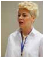
Piše: Sanja Mišević