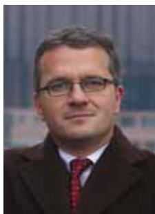
Piše: mr. sc. Igor Materljan