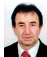
Piše: Dinko Jakelić

Općenito pak, nagodbom se smatra sporazumno preinačavanje sadržaja nekog ranijeg obveznopravnog odnosa s ciljem da kontrahenti suglasnom izjavom volje taj sadržaj prilagode novim okolnostima 5 . Utoliko se nagodba sma-