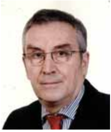
Piše: Igor Hrabar