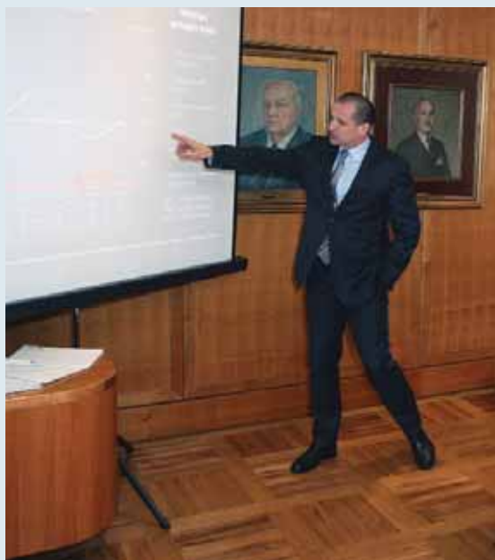
Ministar pravosuđa Orsat Miljenić/Ministar predstavlja reorganizaciju