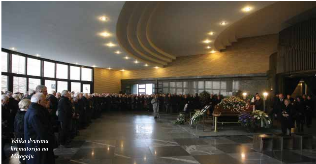
Velika dvorana krematorija na Mirogoju

Zagrebu, član Vijeća za zaštitu slobode javnog informiranja i dr.