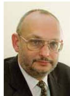
Piše: Ivica Crnić dipl. iur.