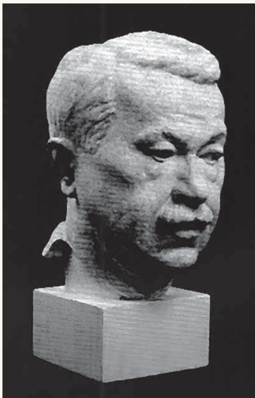
Portret dr. Huga Spitzera oko 1926. g., gips, rad ak. kipara Slavka Brila (1900. – 1943/44.), Zagreb, Gliptoteka HAZU-a, preuzeto iz kataloga retrospektivne izložbe Slavka Brila, Zagreb, 2003./04.;

Ova zadaća nipošto nije laka, ali pokušat ćemo današnjem naraštaju odvjetnika i drugoj publici predočiti djelo tog iznimnog kolege na temelju raspoloživih izvora i sačuvane arhivske građe, kako bi se otelo zaboravu ono što je zaista važno u povijesti hrvatskog odvjetništva. Možda niti jednom odvjetniku Odvjetnički