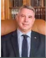
Piše: Josip Šurjak, predsjednik HOK-a

Poštovane kolegice i kolege, poštovani čitatelji, intenzivno razdoblje za odvjetništvo se nastavlja, razdoblje koje od nas zahtijeva posvećenost, predanost i kreativnost u suočavanju s brojnim izazovima i promjenama radi očuvanja naše profesije i njezine samostalnosti. Pandemija koronavirusa, potresi te kontinuirane reforme zakonodavnog okvira koje određuju samu srž naše profesije, ali i način na koji štitimo i možemo štititi prava i interese naših stranaka neka su područja na koja su usmjereni naša pažnja i aktivnosti.