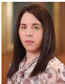
VANA STRAGA Odobren upis na sjednici Izvršnog odbora 1. ožujka 2021., sa sjedištem ureda u RIJECI.