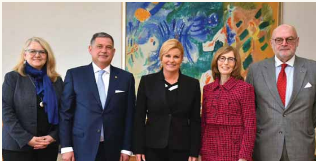
Predsjednica Republike Hrvatske Kolinda Grabar-Kitarović primila je u svom uredu predsjednika HOK-a Roberta Travaša, predsjednicu ABA-e Lindu Klein, predsjednicu Međunarodnog odjela ABA-e Saru Sandford i bivšeg predsjednika HOK-a Marijana Hanžekovića te se s njima zadržala u kraćem razgovoru.

Iako arbitražni sud pri HGK-u postoji već 164 godine, arbitraža u Hrvatskoj nije toliko razvijena i popularna kao što je to slučaj u SAD-u, kazao je Mihajlo Dika ističući da je arbitražni sud pri HGK-u namijenjen i domaćoj i međunarodnoj arbitraži.