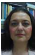
Piše: Ivana Đuras