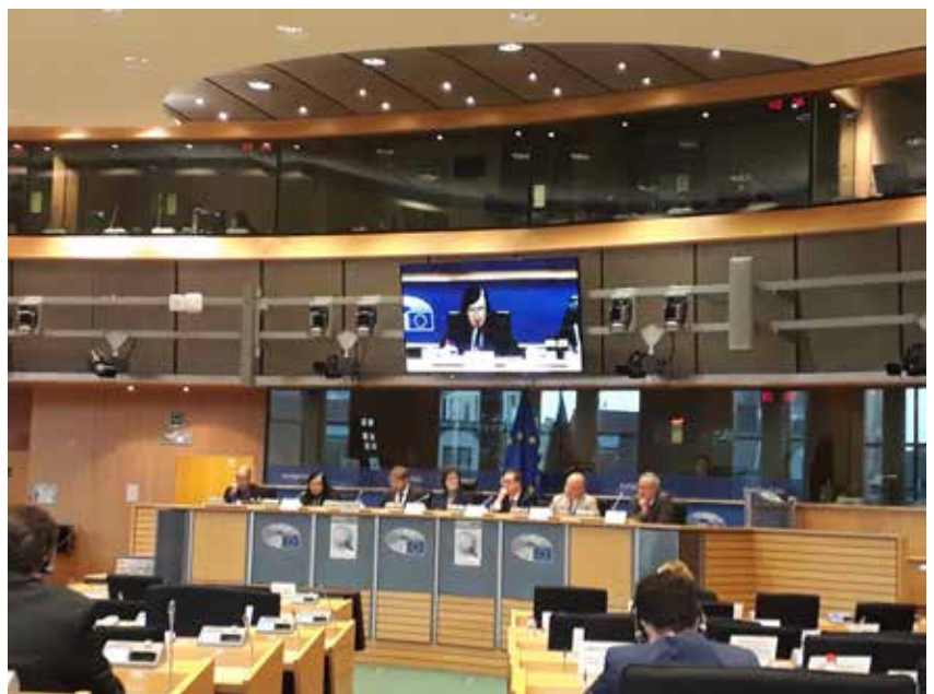
Iain Mitchell QC, predsjednik radne skupine CCBE-a za nadzor, predstavlja stajalište CCBE-a na saslušanju o “Elektronskim dokazima u kaznenim postupcima” pred Odborom LIBE u Europskom parlamentu

Nakon uvoda predsjednika odbora LIBE eurozastupnika Claudea Moraes, program je uključivao predstavljanje istraživanja koje je zatražio LIBE o e-dokazu nakon čega su uslijedili govori govornika koji su predstavljali široki spektar ljudi koji se bave e-dokazima (suci,