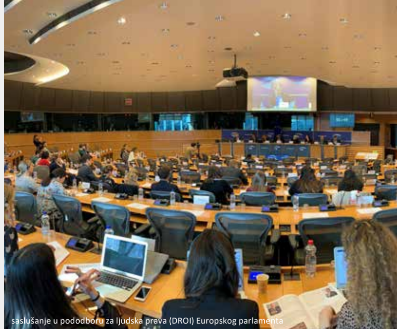
saslušanje u pododboru za ljudska prava (DROI) Europskog parlamenta